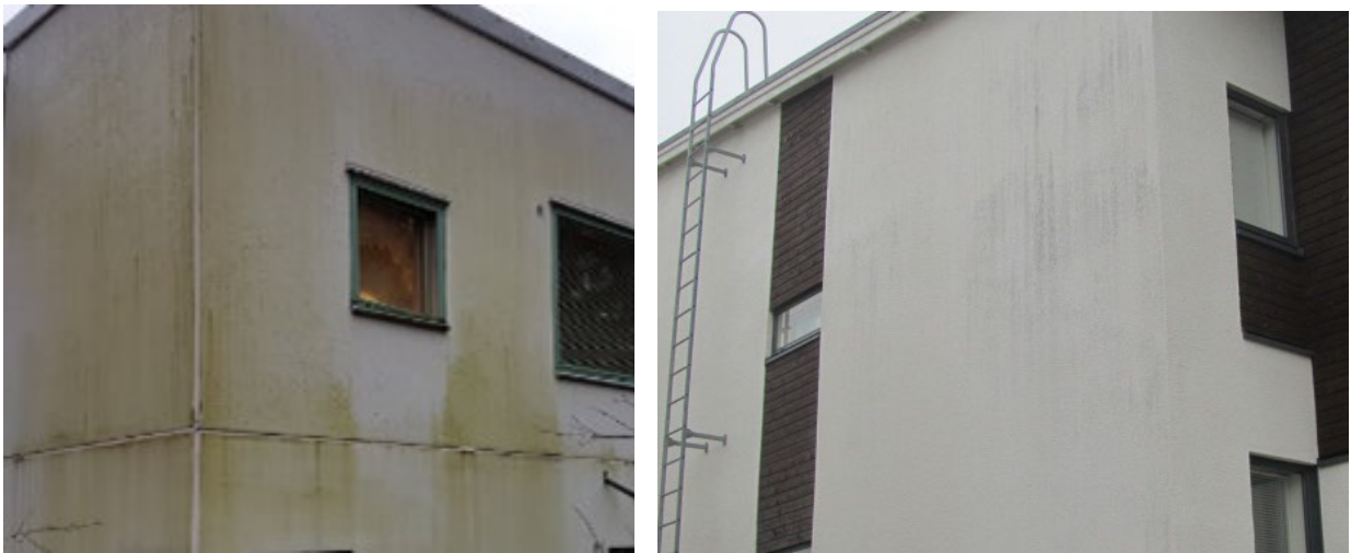
Kuva 2. Esimerkkejä leväkasvustosta julkisivupinnalla, jota voidaan poistaa yllä mainitulla menetelmällä

Ilmastomme on muuttumassa sateisemmaksi ja vuotuiset keskilämpötilat tulevat nousemaan. Kosteus ja lämpö saavat olosuhteet levän ja homeen kasvulle otollisiksi. Julkisivun lähistöllä oleva kasvusto tai varjostavaa puusto luovat otolliset olosuhteet sateisena kautena levän kasvulle. Tyypillisesti levää voi ilmaantua erityisesti julkisivun etelä-länsisuunnassa. Levää voi poistaa paikallisesti harjapesulla, mutta painepesulla saavutetaan paras tulos. Poistoa voidaan tehostaa myös tarkoitukseen soveltuvalla, rautakaupasta saatavalla levänpoistoaineella . Puhdistusaineen käytössä on noudatettava valmistajan ohjeita sekä käytettävä asianmukaisia suojarusteita. Työssä tulee huomioida ympäristön suojaus.