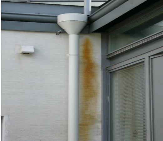
Kuva 1. Tukkeutuneen sadevesirännin aiheuttamia valumajälkiä julkisivulla, ylimääräiset valumat julkisivupinnalla nostavat rappauspintaan kohdistuvaa säärasitusta