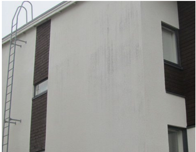
Kuva 2. Esimerkkejä leväkasvustosta julkisivupinnalla, jota voidaan poistaa yllä mainitulla menetelmällä