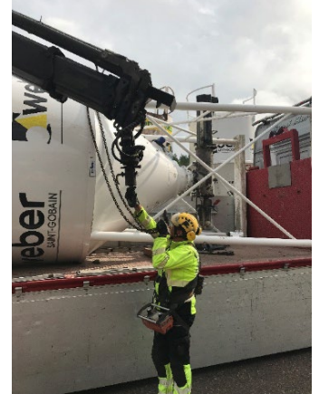
13. Irrota nostoketju nosturista. Sido siilo huolellisesti kiinni ajoneuvoon.