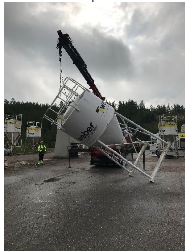
8. Laske siilo hallitusti kyljelleen tasaiselle alustalle.