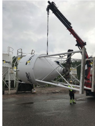
11. Nosta ja siirrä siilo rauhallisesti ajoneuvon lavan päälle. Mikäli siilo ei nostettaessa ole tasapainossa, aseta toinen nostolenkki kannen nostokorvakkeeseen ja hae ketjujenpituuksilla tasapainopiste siilolle.