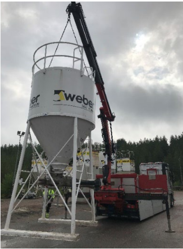
7. Asemoi siilo vapaaseen tilaan kyljelleen laskua varten.