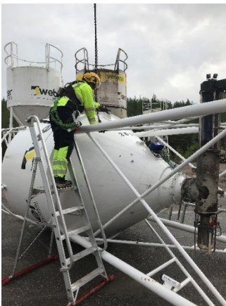
10. Aseta nostolenkit siilon kyljessä olevaan nostokorvakkeeseen.