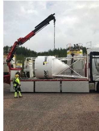
12. Laske siilo varovasti ajoneuvon lavalle.