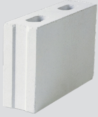
Kahi-väliseinäpöntti (300x85x198) mm