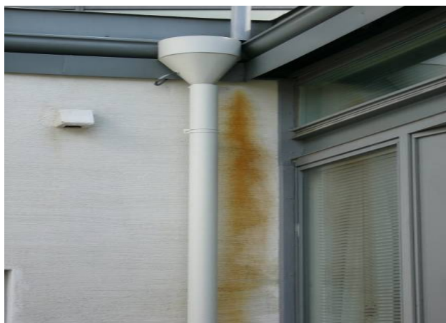
Kuva 1. Tukkeutunut syöksytorvi

Syöksytorvet tulee puhdistaa lehdistä sekä oksista siten, että katolta tuleva sulavesi ja sadevesi pääsevät valumaan suunnitellusti pois rakenteista ja julkisivuilta.